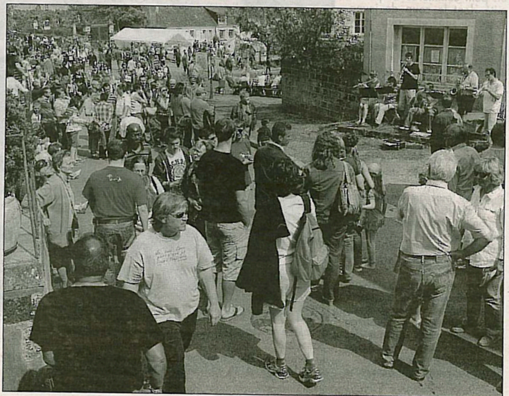
■ Beaucoup de visiteurs pour ce 16 e Marché d'Art qui a bénéficié d'un beau soleil.