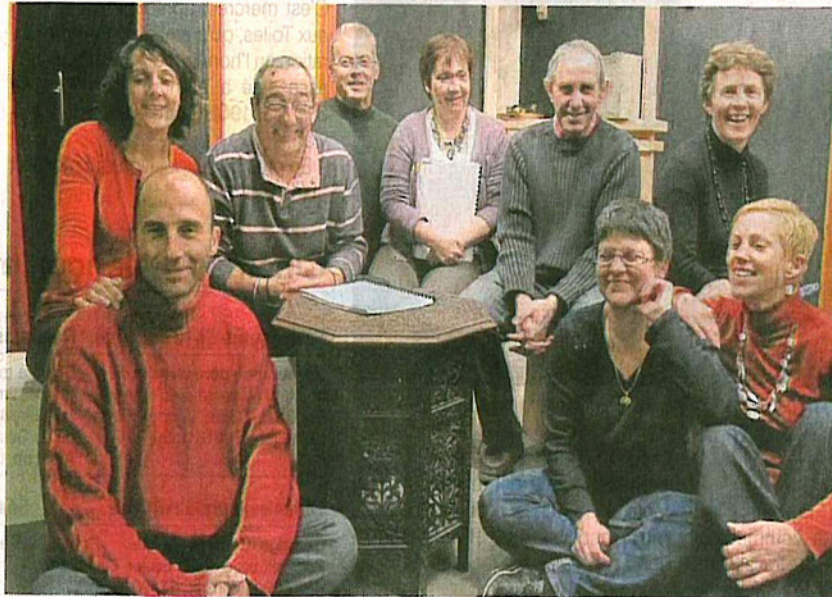
La pièce « Grain de sable », de Thierry Pahud, jouée par la troupe de théâtre du foyer rural, donnera lieu à sept représentations : samedis 3, 10, 17, 24 et 31 mars, vendredis 23 et 30 mars.

Dimanche 11 mars, 12 h 30, repas des anciens combattants à la salle Jacques Martin au Pin-la-Garenne. 13 h 30, loto salle des fêtes de Barville. 14 h 30, après-midi jeux de société organisé par Eperrais